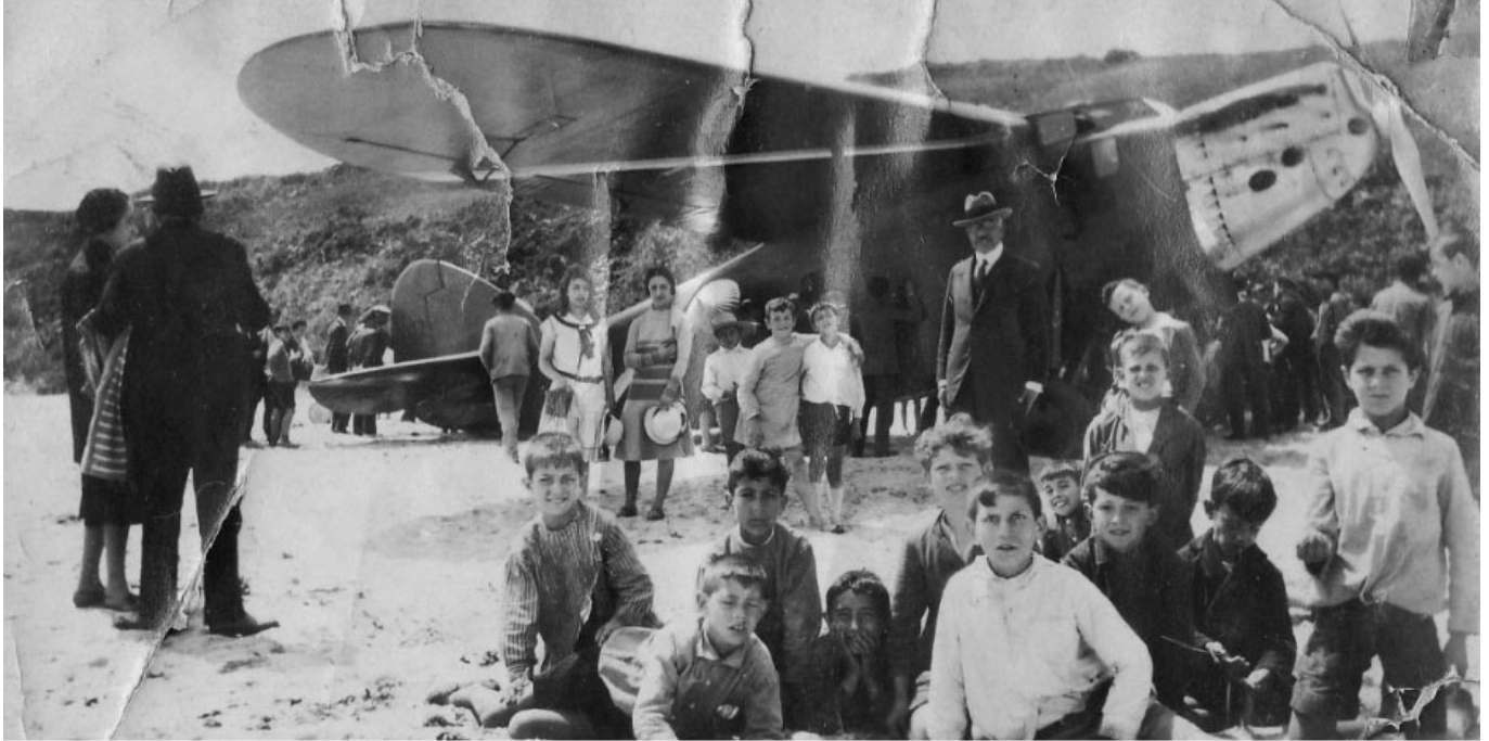
Multitud de curiosos se reunieron en la playa de Oyambre para ver al 'Pájaro Amarillo'

polizón estadounidense al que todos querían entrevistar, llegando incluso a ofrecerle 11.000 dólares, por parte de un periódico americano, para obtener una exclusiva. Fiel al contrato que había firmado con Lotti, rechazó la oferta.